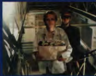
Za rolę w „Przesłuchaniu” aktorka dostała Złotą Palmę w Cannes