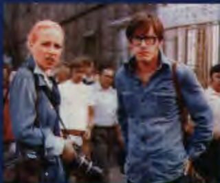
Z Jerzym Radziwiłowiczem w filmie „Człowiek z marmuru”