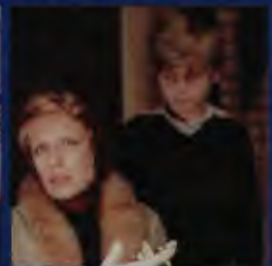
Kadr z filmu „Kochankowie mojej mamy”