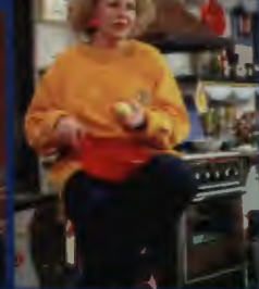
Próba „Shirley Valentine” w Teatrze Polonia