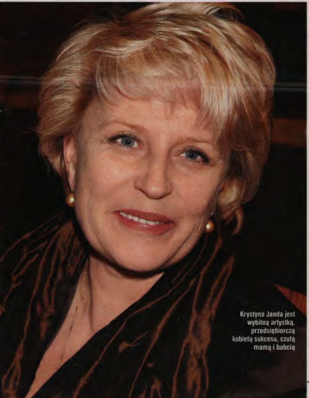
Krystyna Janda jest wybitną artystką, przedsiębiorczą kobietą sukcesu, czującą mamą i babcią