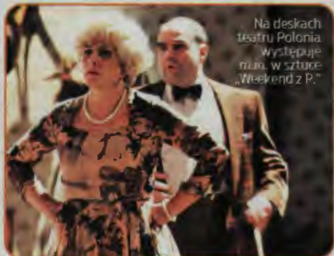
Na deskach teatru Polonia występuje num. w sztuce „Weekend z P.”

mie tym wcieliła się w postać głównej bohaterki Agaty. Krytycy filmowi okrzyknęli ten film najlepszym debiutem reżyserskim roku.