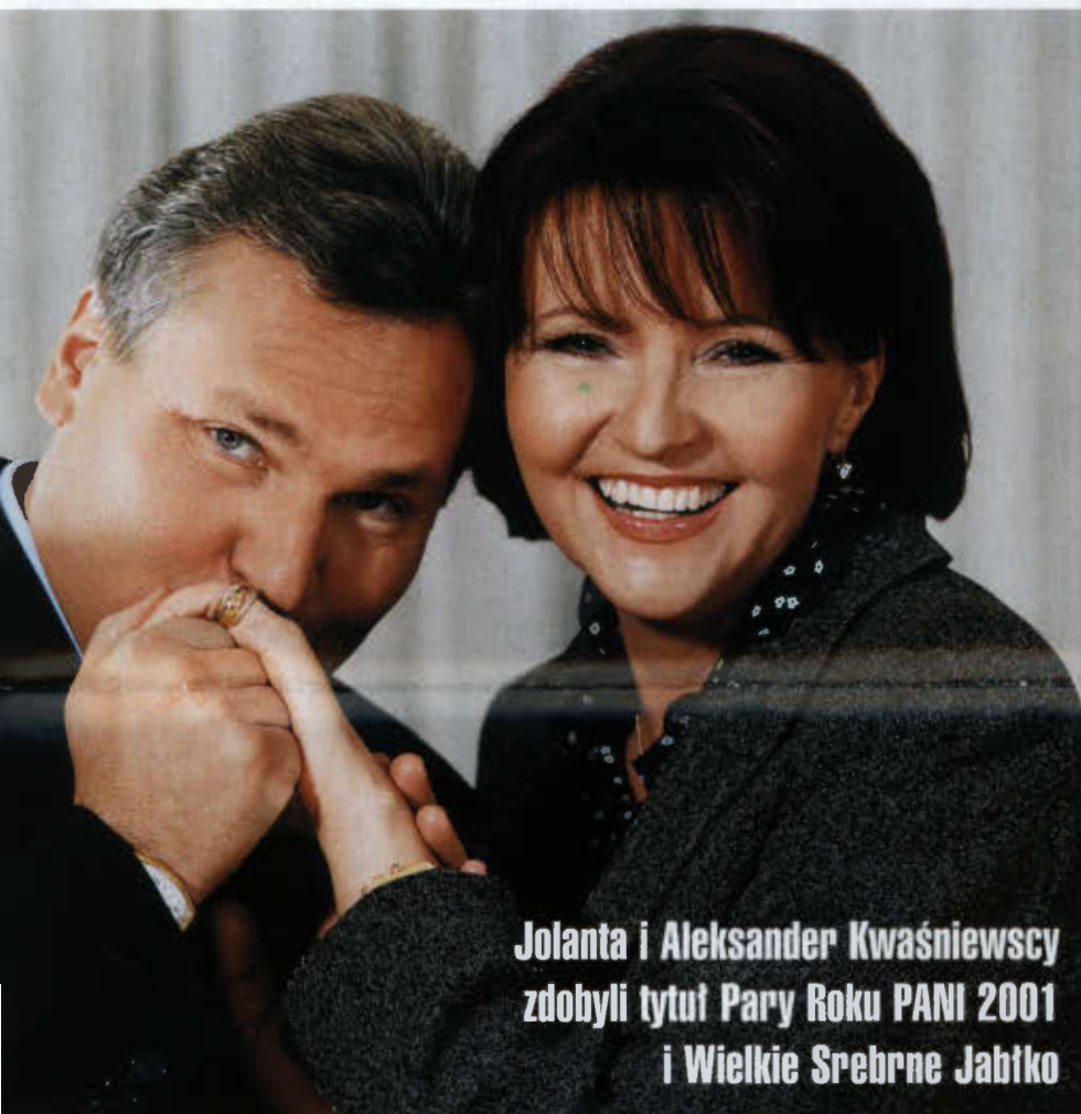
Jolanta i Aleksander Kwaśniewscy zdoyleli tytuł Pary Roku PANI 2001 i Wielkie Srebrne Jabtko