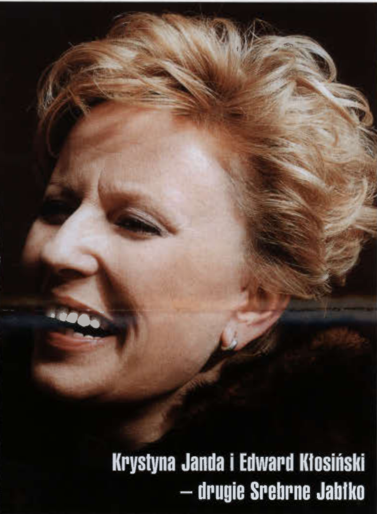
Krystyna Janda i Edward Kłosiński – drugie Srebrne Jabłko