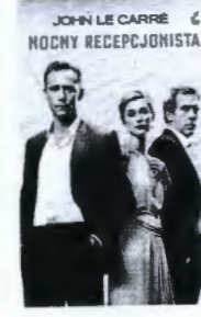
John Le Carré Nocny recepcjonista Sonia Draga

To chyba najpełniejszy portret najwybitniejszej współczesnej polskiej aktorki. Wydaje się, że to tylko jeden z wielu ostatnio pojawiających się opasłych książkowych wywiadów, ale nie tylko – to coś o wiele więcej. W tym grubym tomie znajdziemy spore fragmenty z rozmaitych tekstów autobiograficznych pisanych przez samą Jandę, nawet z jej bloga. To bezkompromisowa i szczerza sylwetka aktorki, która od lat idzie własną ścieżką kariery i zwykle odnosi sukcesy, ale nie ma również problemu z tym, by uczciwie i szczerze opowiedzieć, jak kilka razy ta ścieżka zaprowadziła ją na manowce.