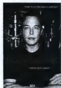
Vance Ashlee Elon Musk. Biografia twórcy PayPala, Tesli, SpaceX Znak Horyzont

Mistrz powieści grozy nie ustaje i co roku dostarcza nam nową świetną powieść. Tegoroczna to połączenie kryminału i fabuły z elementami nadprzyrodzonymi (czyli tego, w czym King jest najlepszy od dekad). „Koniec warty” domyka trylogię o detektywie Billu Hodgesie. Znany z „Pana Mercedesa” sprawca masakry Brady Hartsfield wybudza się ze śpiączki i chce zemścić się na swych wrogach. A że wszystko wskazuje na to, iż posiada nowe moce, staje się jeszcze bardziej niebezpiecznym przeciwnikiem. King jak zwykle świetnie spleta akcję, horror i wyśmienite obserwacje amerykańskiej codzienności.