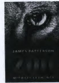
James Patterson, Michael Ledwidge Zoo Albatros

Jedyny komiks w tym zestawie z pewnością nie jest lekturą dla dzieci. To ciekawa i udana próba połączenia klimatu czarnego kryminału i opowieści o superbohaterach, i to jeszcze z kobietą w roli głównej. Tytułowa Jessica Jones to nowojorska prywatna detektyw, która jakoś nie sprawdziła się w roli superbohaterki i teraz zarabia na życie prostymi detektywistycznymi pracami. Próbuje też przy tym nie kłąć, ale rzadko jej się udaje. Nawet jej życie seksualne jest dość skomplikowane. Na podstawie tego powstał niedawno głośny serial.