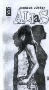
Brian Michael Bendis, Michael Gaydos Jessica Jones: Alias #1 Albatros

Jedyny komiks w tym zestawie z pewnością nie jest lekturą dla dzieci. To ciekawa i udana próba połączenia klimatu czarnego kryminału i opowieści o superbohaterach, i to jeszcze z kobietą w roli głównej. Tytułowa Jessica Jones to nowojorska prywatna detektyw, która jakoś nie sprawdziła się w roli superbohaterki i teraz zarabia na życie prostymi detektywistycznymi pracami. Próbuje też przy tym nie kłąć, ale rzadko jej się udaje. Nawet jej życie seksualne jest dość skomplikowane. Na podstawie tego powstał niedawno głośny serial.