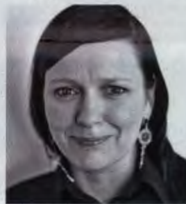
8. Katarzyna Nosowska 37 lat

Za odważne stawianie w obronie standardów demokracji i niezależności instytucji, której prezuje. Jako szef Trybunału Konstytucyjnego pokazał, że nie można nałożyć wyroków do potrzeb polityków. TK pod jego przewodnictwem odrzucił część niekonstytucyjnych przepisów forsowanej przez rząd ustawy lustracyjnej. Sam Stępień śmiało skrytykował też ministra sprawiedliwości Zbigniewa Ziobrę, gdy ten skazał w czasie konferencji prasowej aresztowanego chirurga, czym złamał zasadę domniemania niewinności.