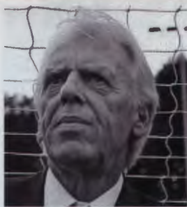
1. Leo Beenhakker 66 lat

Spośród nominacji grono redaktorów i dziennikarzy naszego tygodnika wybierze kilkoro laureatów. 25 lutego wręczymy im nagrody w postaci symbolicznych statuetek. Uznanie i szacunek wyrażane naszymi wyborami są jednak tak bezinteresowne jak dokonania tych, których odwagę, mądrość i talent podziwiamy i których postanawiamy docenić tytułami Fenomenów.