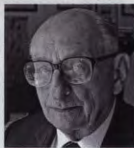
2. Profesor Władysław Bartoszewski 86 lat

Udowodnił, że sukces zależy od determinacji i siły spokoju. Pokazał Polakom, że można osiągnąć cel mimo niesprzyjających warunków, bo nie ukrywa, że nasze stadiony piłkarskie to po prostu dno. Mieszkający w Belgii Holender Leo Beenhakker prowadził drużynę Realu Madryt, Ajaksu Amsterdam, reprezentacje Holandii oraz Trynidadu i Tobago. Teraz wprowadził Polaków do mistrzostw Europy w 2008 roku.