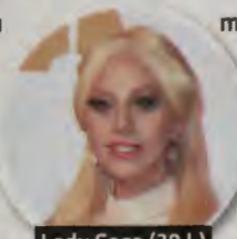
Lady Gaga (30 l.)

Ledwo dwa tygodnie temu popularna amerykańska wokalistka zdała egzamin na prawo jazdy. Niestety, Lady Gaga (30 l.) nie miała wiele szczęścia, bo gdy wybrała się swoim nowym autem Fordem F-150 SVT Lightning na wycieczkę po kalifornijskich drogach, została zatrzy-