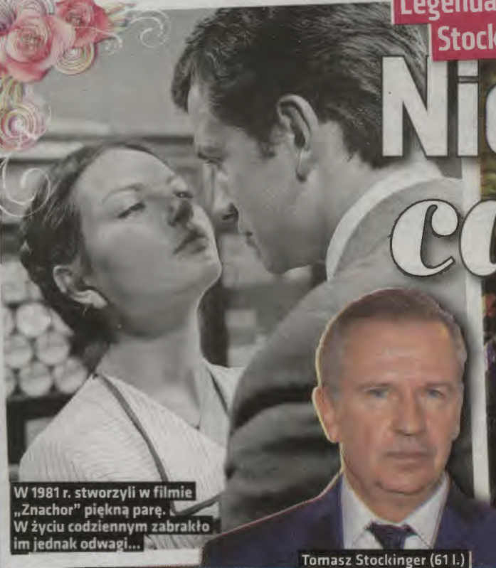
W 1981 r. stworzyli w filmie „Znachor” piękną parę. W życiu codziennym zabrakło im jednak odwagi...