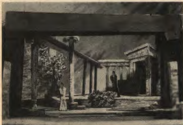
»Elektra« Giraudoux (r. 1946). Makieta