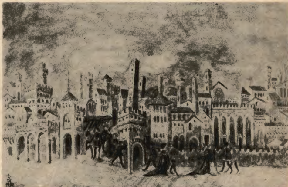
»Romeo i Julia« Prokofjewa (r. 1954). Projekt dekoracji