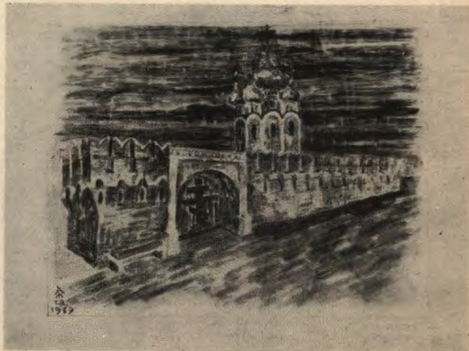
»Borys Godunow« Musorgskiego (r. 1960). Projekt dekoracji