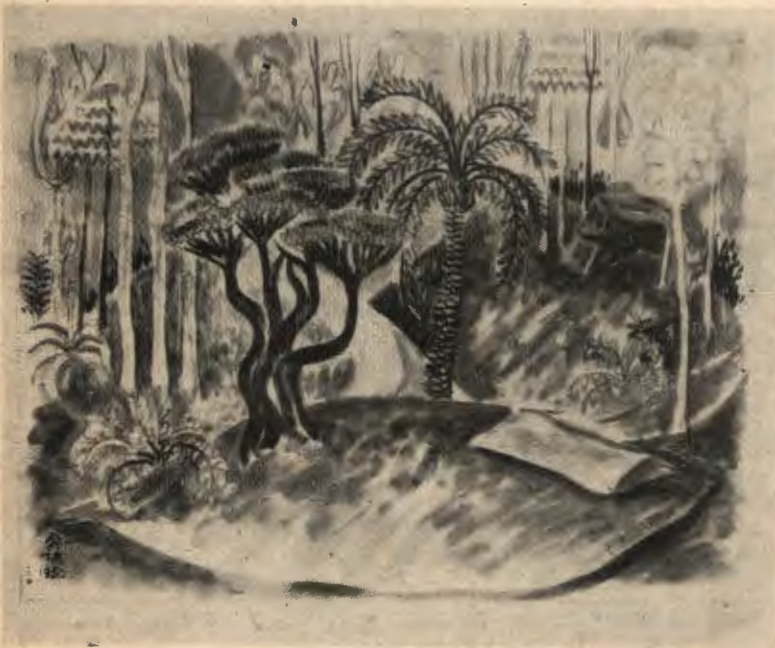
»Jak wam się podoba« Szekspira (r. 1951). Projekt dekoracji