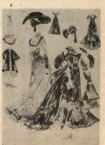
Projekty kostiumów: 1. »Wielki człowiek do małych interesów« Fredry; 2. »Elektra« Giraudoux; 3. »Fantazy« Slowackiego; 4. »Jak wam się podoba« Szekspira; 5. »Romeo i Julia« Prokofjewa; 6. »Kobieta bez skazy« Zapolskiej