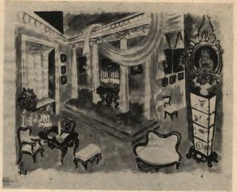
»Fantazy« Slowackiego (r. 1948). Projekt dekoracji