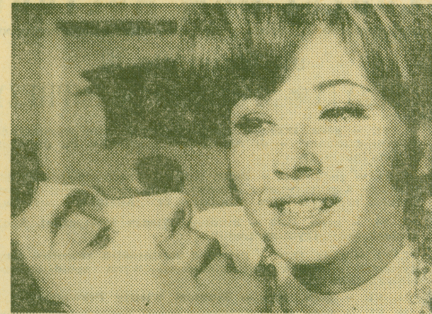
Kadr z filmu „Nie drażnić cioci Leontyny”.