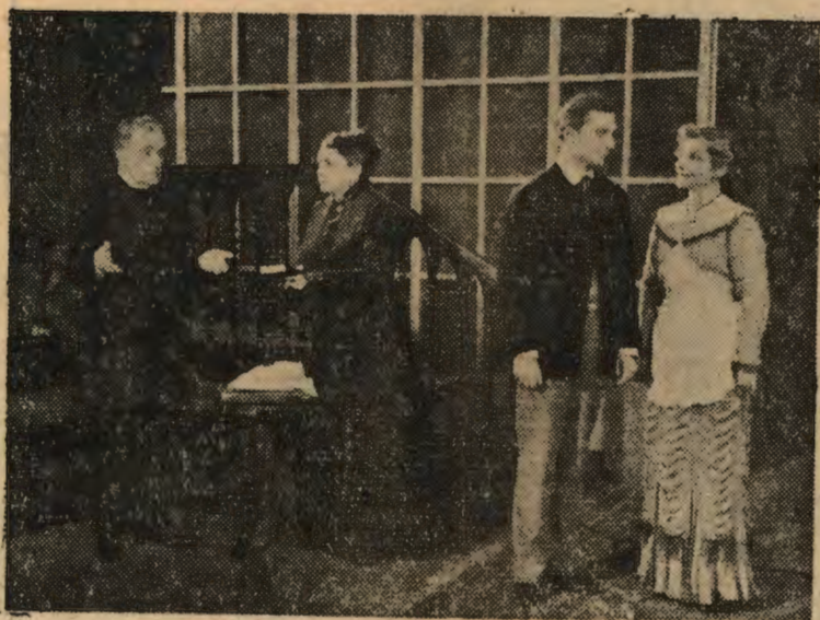
Scena z I aktu.

W TEATRZE Ludowym, jedynym teatrze warszawskim pamiętano o 59 rocznicy śmierci Henryka Ibsena, znakomitego pisarza norweskiego.