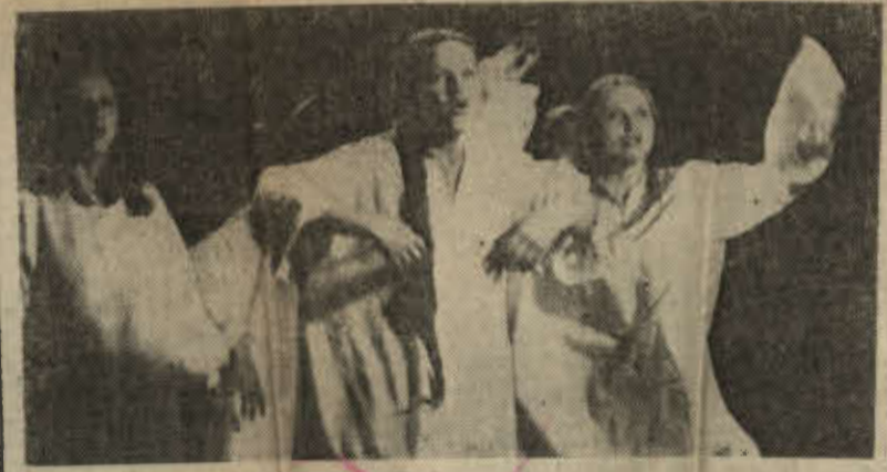
W swej pogoni za babem, wieśniacy spotykają nad rzeką dziewczęta

otrzymali I nagrodę na Festiwalu Teatrów Bułgarskich w 1979 roku. „Próba lotu” jest sztuką poetycką, pełną metafor, absurdu i humoru, i jak to u Radiczkowa bywa, połączenia (DOKOŃCZENIE NA STR. 2)