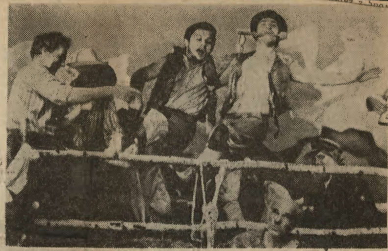
Wieśniacy zaczynają odczuwać niezwykłość swego lotu, który wydaje im się niereczywistym snem