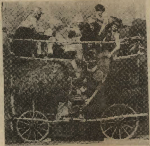
Chcąc zjapać tajemniczy balon, chłopcy wdrapują się na wóz z sianem