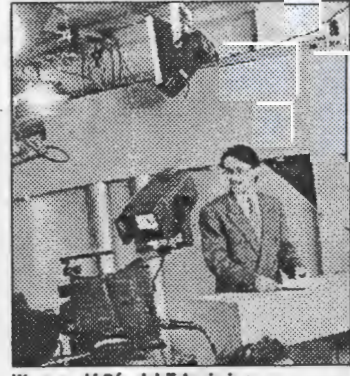
Warszawski Ośrodek Telewizyjny