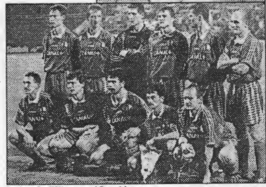
Drużyna Legii Warszawa i Paweł Janas