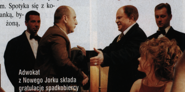
Adwokat z Nowego Jorku składa gratulacje spadkobiercy