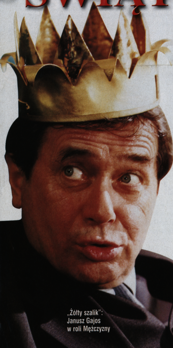
„Złoty szalik”: Janusz Gajos w roli Mężczyzny