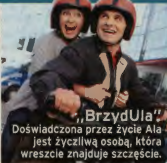
„BrzydUla” Doświadczona przez życie Ala jest życzliwą osobą, która wreszcie znajduje szczęście.